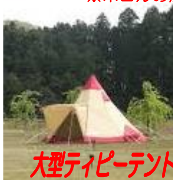
大型ティピーテント